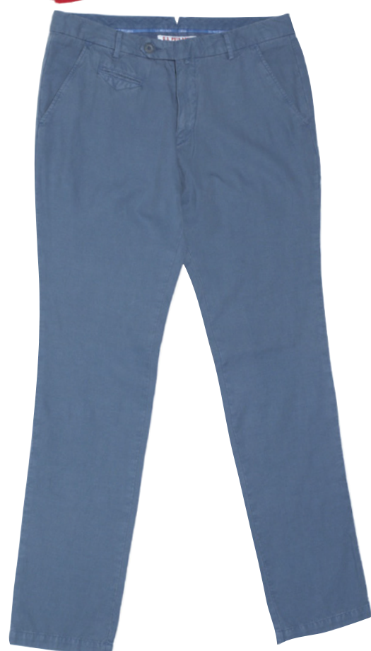
POLO en coton piqué brodé, 87 € CHINO en coton, 129 €