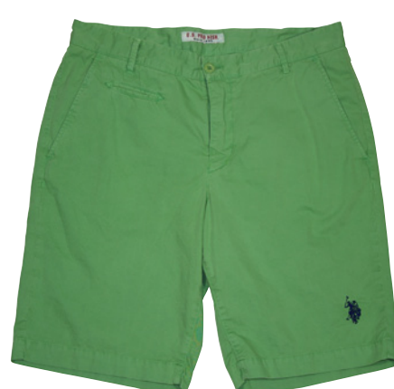
BERMUDA en coton, 89 €