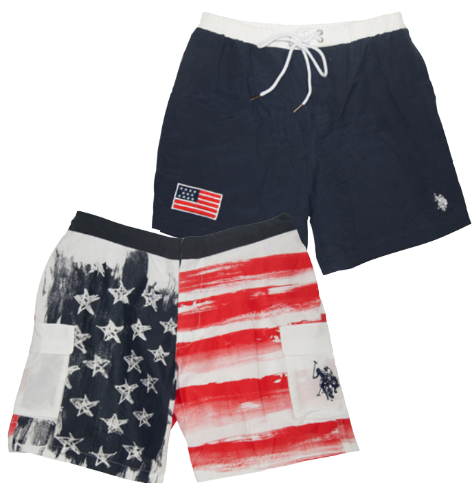
SHORT DE BAIN en polyamide, imprimé drapeau américain, 59 €