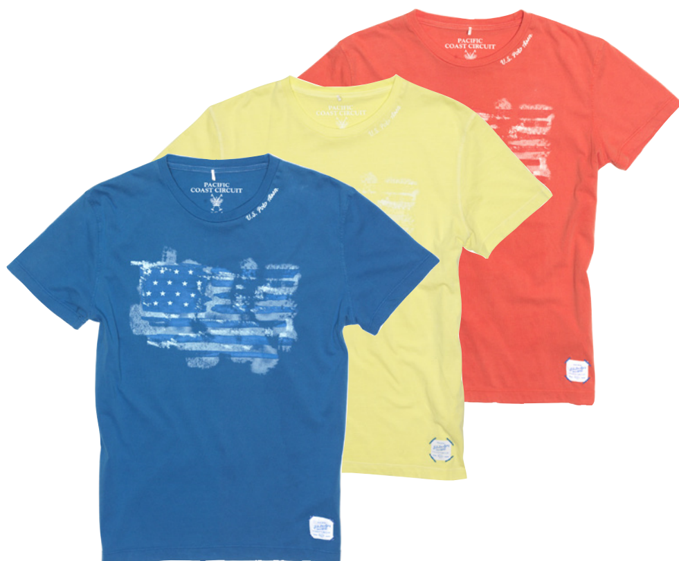
T-SHIRT en coton imprimé drapeau américain, 49 €