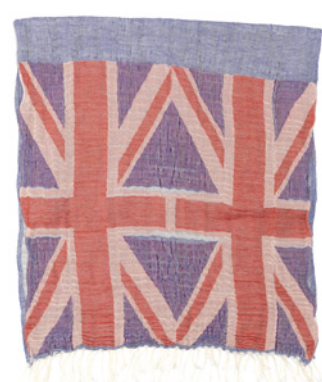
CHÈCHE imprimé drapeau anglais 89 €