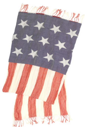
CHÈCHE imprimé drapeau américain 89 €