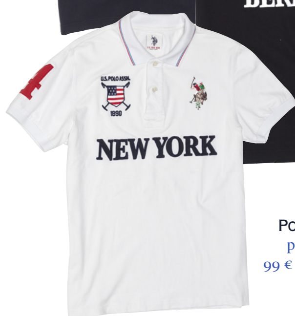
POLOS en coton piqué brodés, 99 € (NY, Londres...)