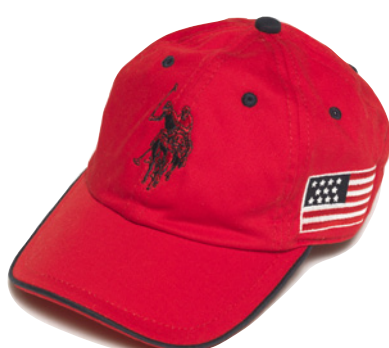
CASQUETTE brodée drapeau américain, 32 €