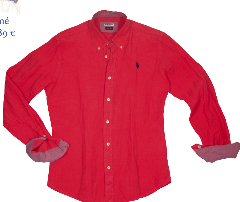
CHEMISE en lin, 99 €