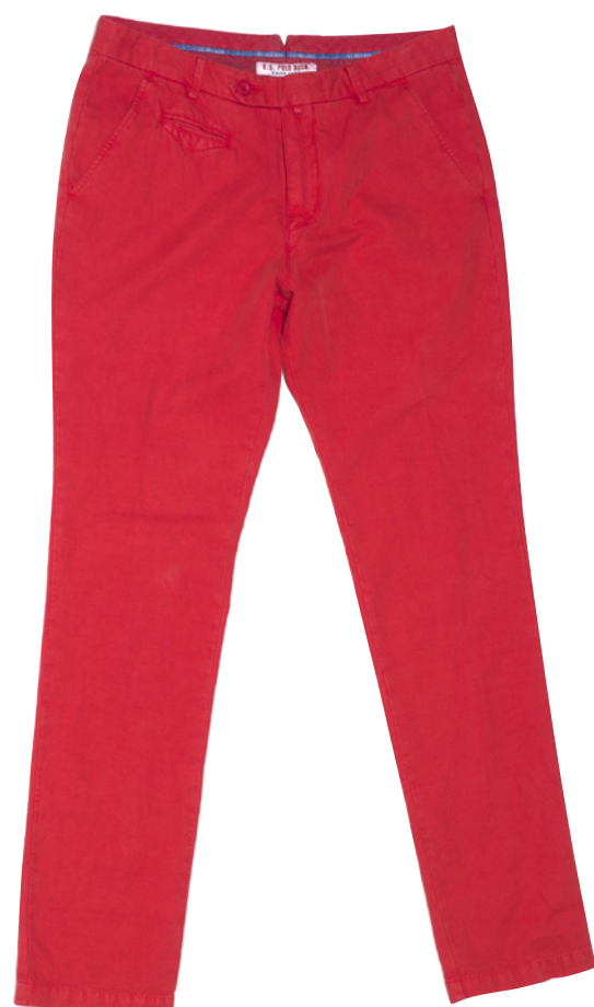
POLO en coton bicolore, 99 € CHINO en coton, 129 €